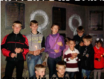
Тих день без двору